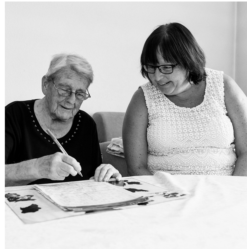
Gegenseitiger Respekt. Eine Besucherin im Einsatz bei einer Kundin.

Das Fachteam freut sich auf Ihre Kontaktaufnahme unter Telefon 032 628 36 36.